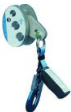
Suwak do szyny asekuracyjnej