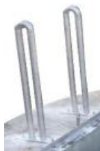
Poręcze złączowe stałe