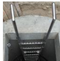
Poręcze złączowe wysuwane