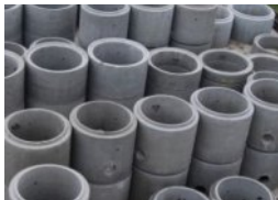
Nadstawki dedykowane wys. 250 mm - 2000 mm