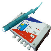
Alarm przepełnienia i poziomu zanieczyszczeń (patrz str. 65)