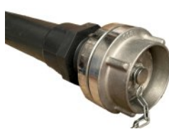
Instalacja do opróżniania DN 65